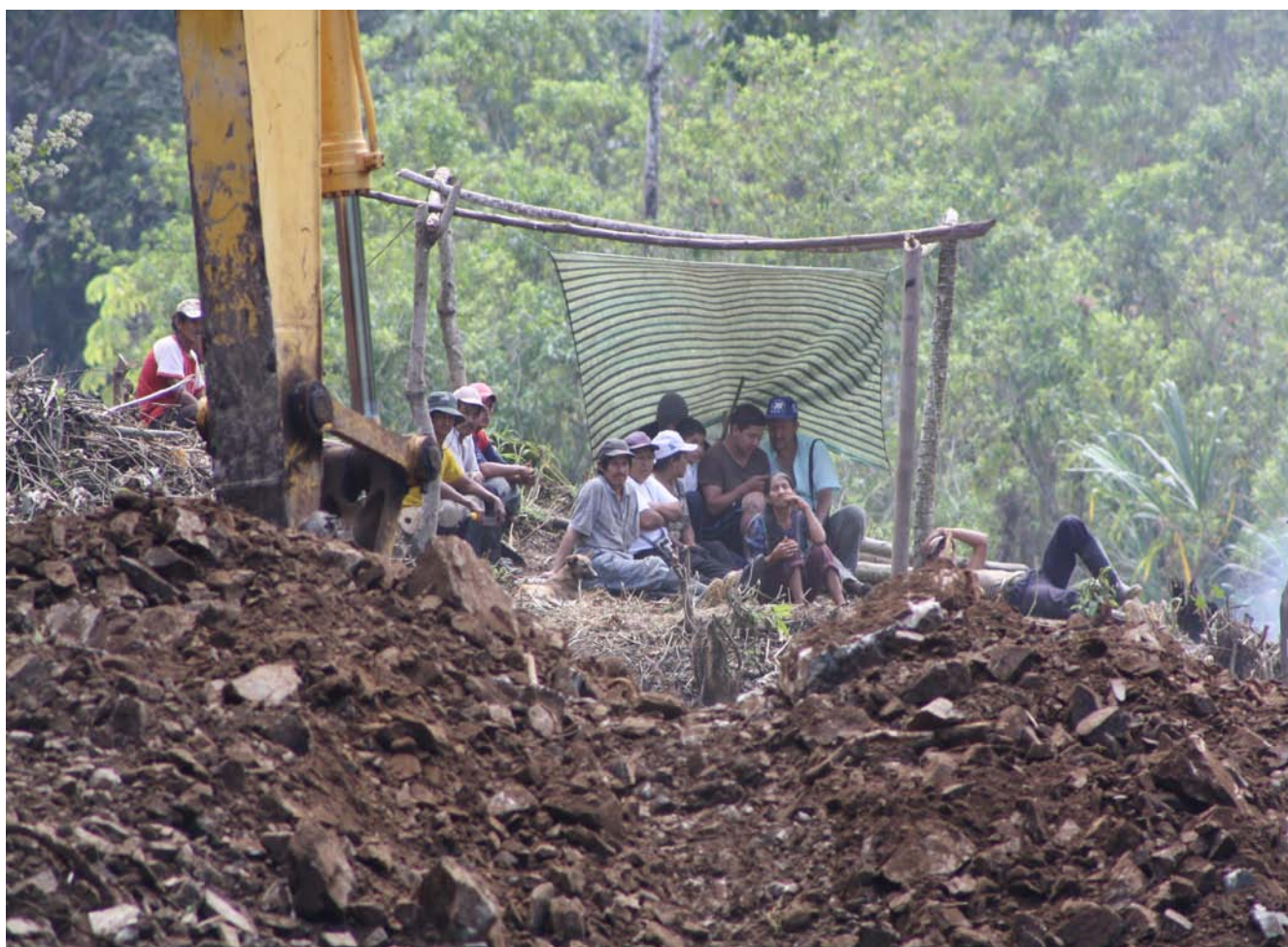
Pobladores de San Pablo de Amalí ejercen su derecho constitucional a la Resistencia (2012)