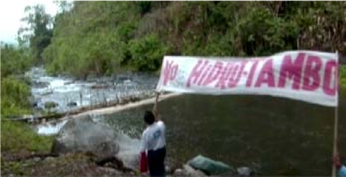
Líderes y comuneros protestan junto al río Dulcepamba (2007)