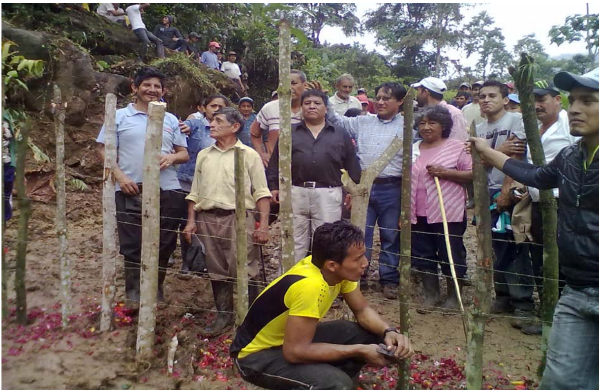
Movilización campesina en San Pablo de Amalí (Mayo 2012)