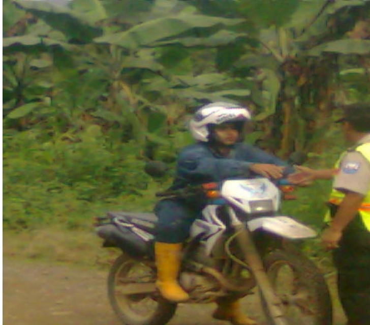
Empleado de la compañía Hidrotambo utiliza una moto policial (2012, archivo de la comunidad)

Según este texto las autoridades encargadas de propiciar la “paz y tranquilidad”, de forma inquisitiva solicitan que se aplique la ley, califican a los dirigentes de “falsos” sin tener un fundamento, evidenciando el hostigamiento y persecución del cual son objeto las y los defensores de los Derechos Humanos y la Naturaleza.