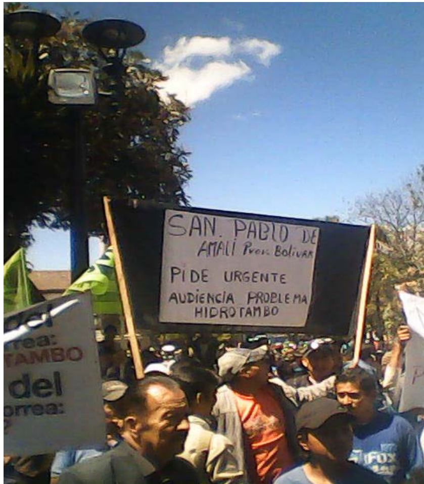
Movilización en Quito de San Pablo de Amalí pidiendo audiencia con la Presidencia de la República (2012)