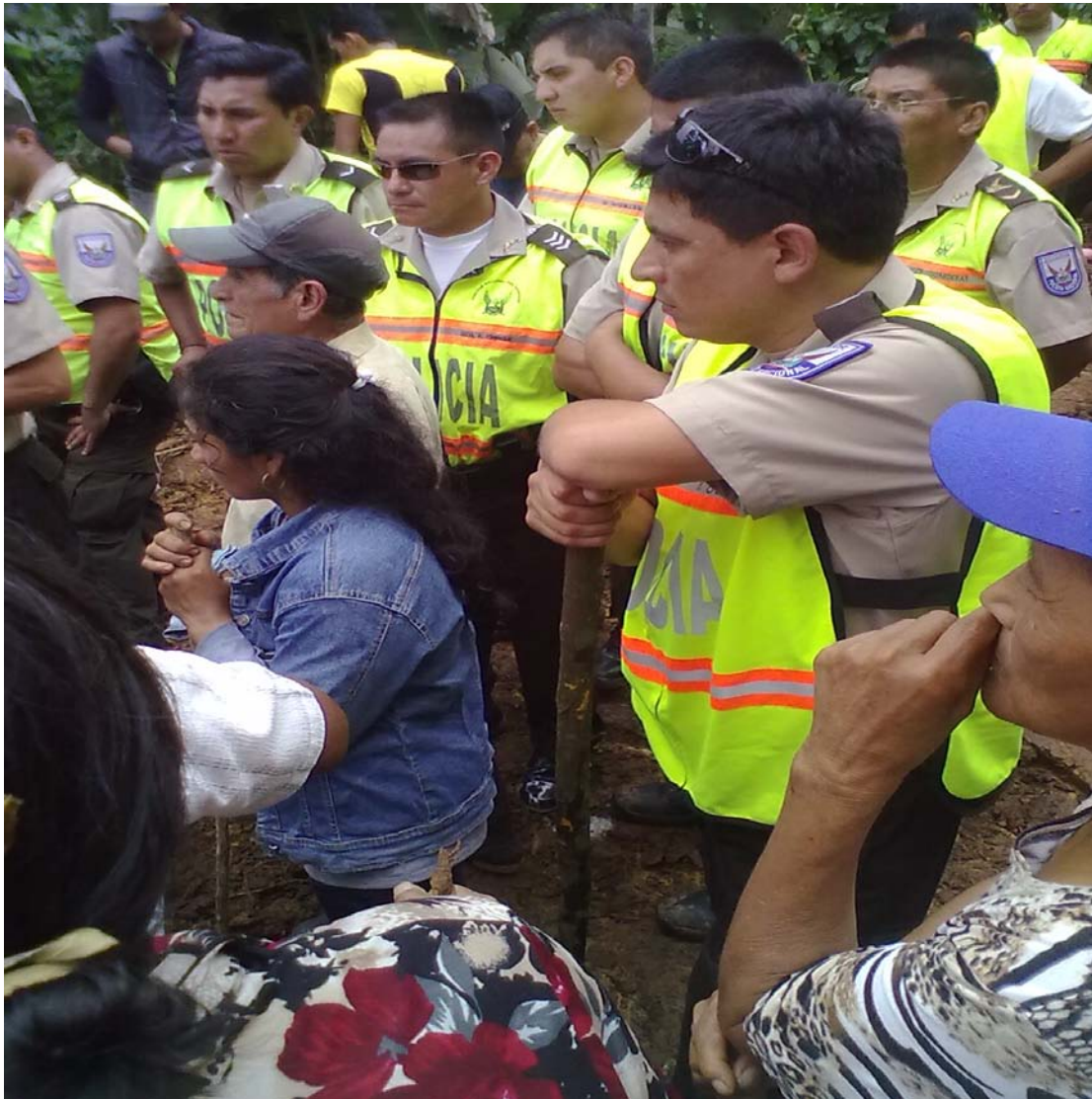
La presencia policial en San Pablo de Amalí ha sido permanente desde marzo de 2012 (foto tomada en mayo 2012)

“En la actualidad, una de las causas sociales más importantes mediante la cual los pueblos campesinos y ancestrales (indígenas, montubios, afroecuatorianos) del país se expresan, es la defensa de sus territorios y recursos naturales frente a las actividades extractivas y otras ambientales no sustentables ni socialmente equitativas” 55